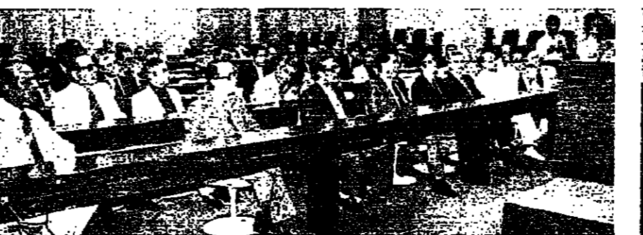
جانب من المشاركين في الحلقة